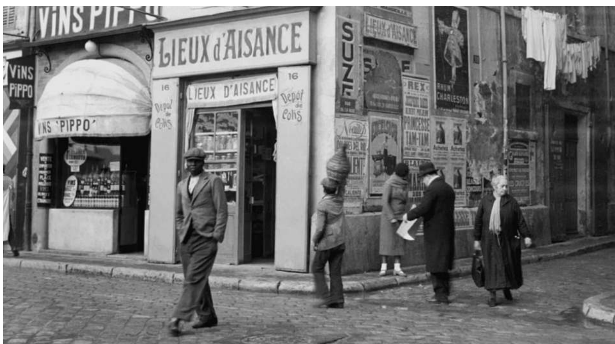
Image d'archive des années 20 à Marseille, extraite du Film McKay, de Harlem à Marseille de Matthieu Verdeil